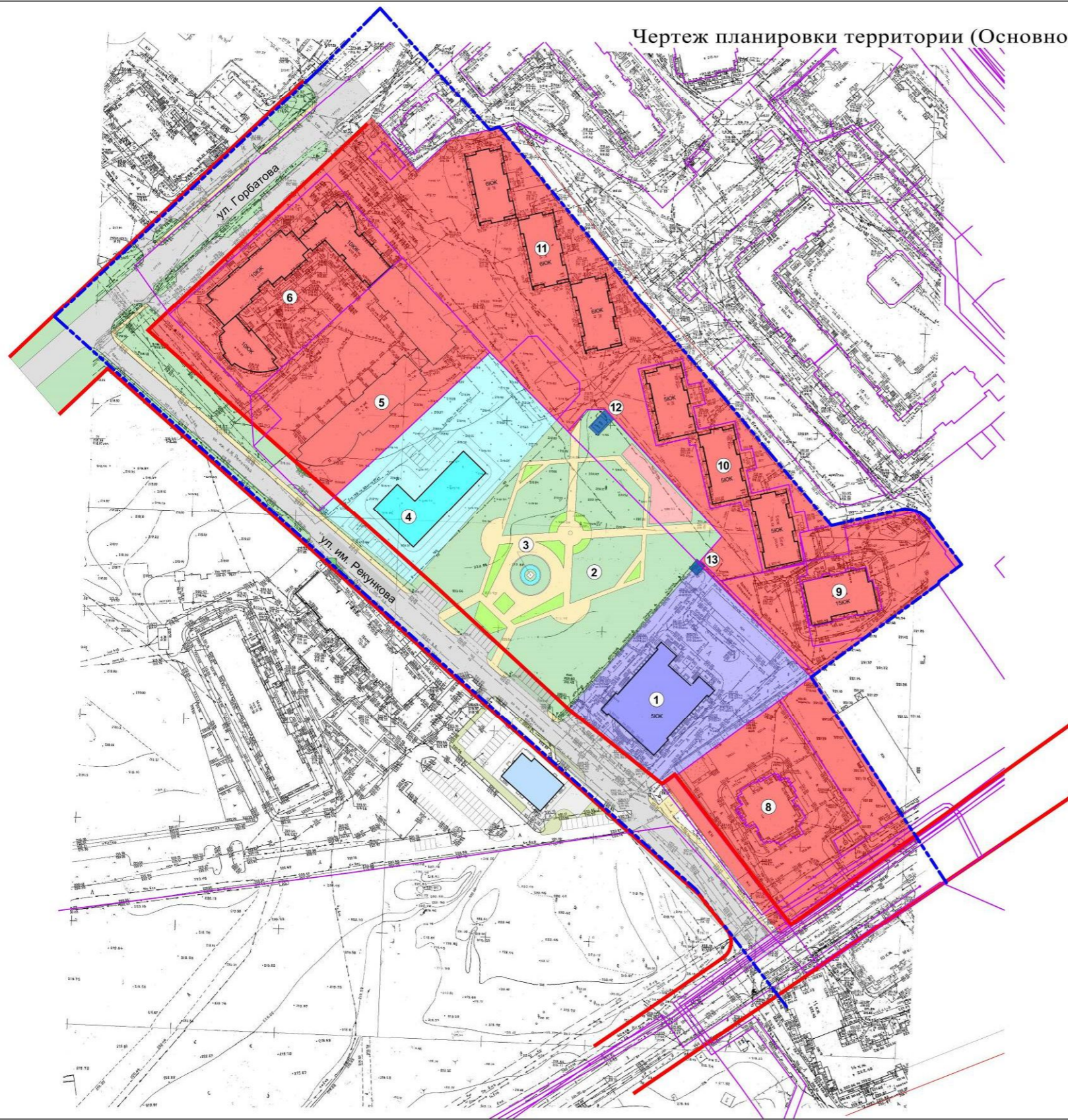
Чертеж планировки территории (Основной чертеж.) М 1:1000

Проект внесения изменений в проект планировки территории бывшего аэропорта, расположенной в Советском районе города Брянска, утвержденный постановлением Брянской городской администрации от 10.09.2009 № 1629-п, в границах квартала, ограниченного улицами Крахмалева, Горбатова, Евдокимова, Рекункова в Советском районе