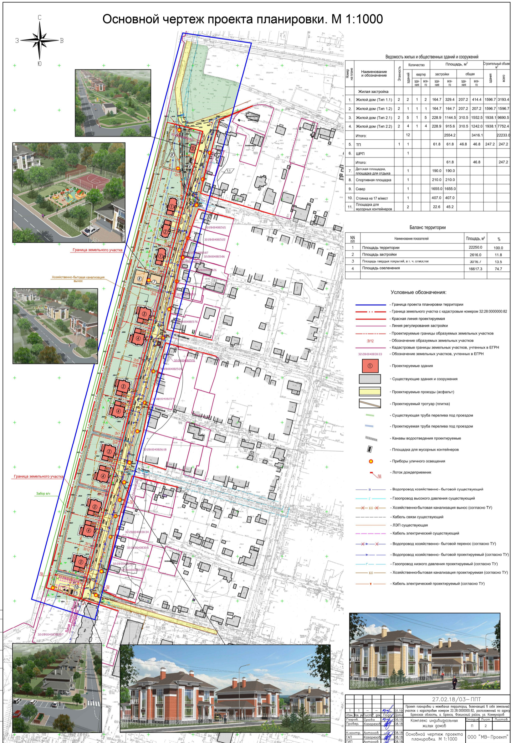
Ведомость жилых и общественных зданий и сооружений