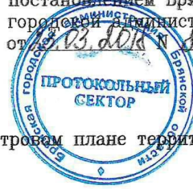
СХЕМА РАСПОЛОЖЕНИЯ земельного участка или земельных участков на кадастровом плане территории

Утверждена постановлением Брянской городской администрации от 03.03.2018 № 139-н