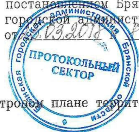
СХЕМА РАСПОЛОЖЕНИЯ земельного участка или земельных участков на кадастровом плане территории

Утверждена постановлением Брянской городской администрации от 23.03.2018 № 44-0