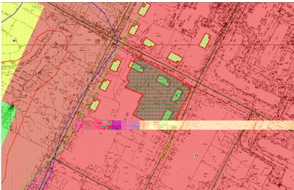
Схема территории, подлежащей развитию

ориентировочная площадь территории, подлежащей развитию — 3570 м 2